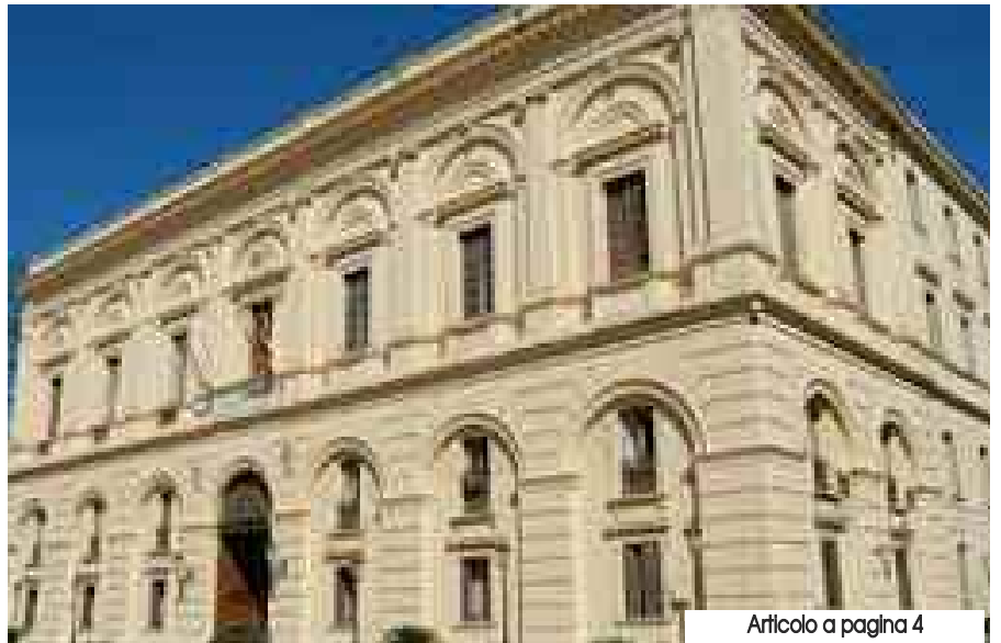
Articolo a pagina 4