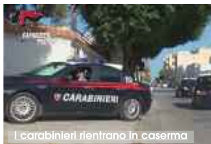
I carabinieri rientrano in caserma